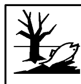
Dangereux pour l'environnement